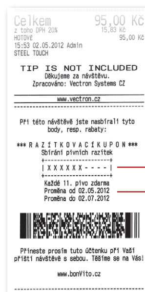
Účtenka Digitální karta s razítky