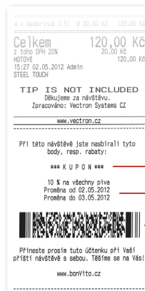
Účtenka Kupón na účtence

Kontaktujte laskavě firmu Vectron pro další informace na telefonním čísle 224 934 160 nebo 603 182 188 bonvito@vectron.cz • www.vectron.cz/bonvito